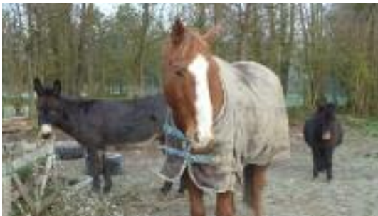
Assos // Stages, soins et Equifeel au programme d'Érimûr'Ânes - p 7