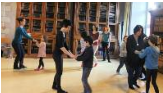
Culture // Atelier de danse parents enfants à la médiathèque - p 13