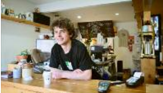
C'est dans l'air // Trouvez votre emploi saisonnier avec l'Espace Jeunes - p 3

Journal Municipal de la Ville de Mûrs-Érigné - n°111 Février Mars 2017