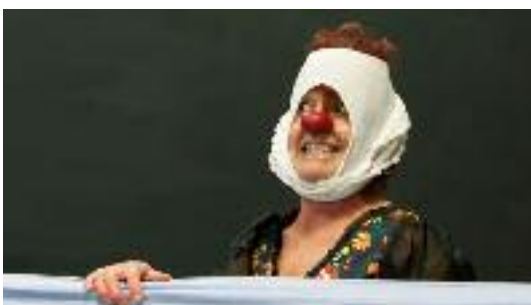
Culture // Le festival de théâtre Ça Chauffe revient - p 14