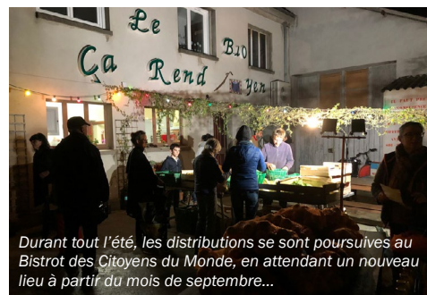
Durant tout l'été, les distributions se sont poursuivies au Bistrot des Citoyens du Monde, en attendant un nouveau lieu à partir du mois de septembre...

[ Contact : AHCV au 06 61 82 70 03 ou à comahcv@gmail.com ]