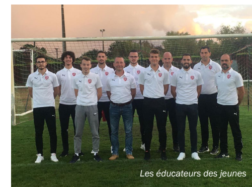
Les éducateurs des jeunes

[ Contact : ASI Football à asimursfoot@gmail.com , sur asimurserigne.e-monsite.com ou Facebook : ASI-Mûrs-Érigné-Football ]