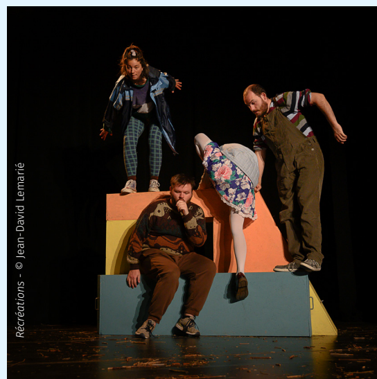
Récréations - © Jean-David Lemarrié

● Durée : 1h - tout public, à partir de 5 ans ● Tarif : 5€