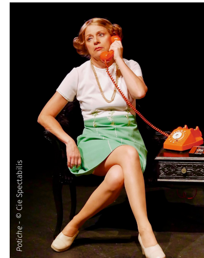
Potiche - © Cie Spectabilis

● Durée : 2h avec entracte - tout public à partir de 12 ans ● Tarifs : plein 8€, réduit 6€