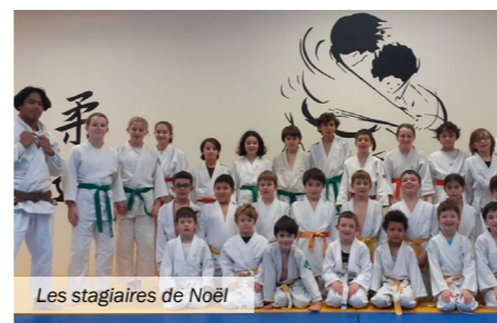
Les stagiaires de Noël

Aux vacances de Noël, les judokas du Judo Jujitsu Mûrs-Érigné (JJME) se sont rassemblés pour partager 2 jours d'immersion dans leur sport favori.