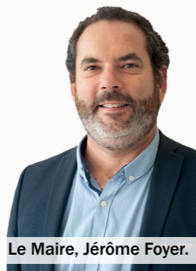
Le Maire, Jérôme Foyer.

Enfin, je vous invite à la rencontre dans les rues de notre ville ou mieux encore, dans l'allée de notre marché, désormais hebdomadaire, le vendredi de 16 h 30 à 19 h 30.