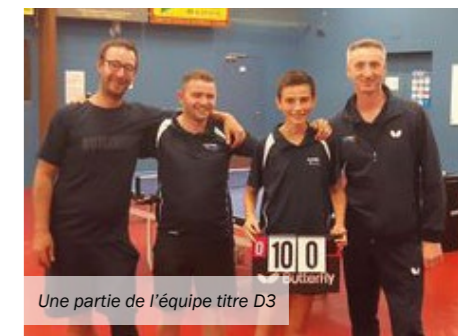
Une partie de l'équipe titre D3

En parallèle, des différentes activités sportives, l'ASI TT est toujours en pleine ébullition avec les diverses manifestations (Open Anjou Ping, Loto, Tournoi National du 30 avril/1 er mai...) et pour cette année un fil rouge avec les 50 ans du club qui seront célébrés le 29 avril avec plein de surprises...noter sur votre agenda.