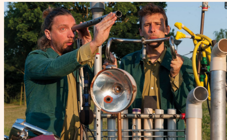
Spectacle ExtraWagon par la compagnie W3

Les 3 et 4 avril, la compagnie W3 présentera aux plus petits (de la PS au CP) son spectacle «ExtraWagon». Ce spectacle musical est construit autour d'un caddie transformé en véritable instrumentarium ambulante pour une immersion dans un univers burlesque, poétique, et délicieusement suranné. Flûtes, clarinettes, didjeridoo, rimbatus et autres percussions ont été fabriqués par les deux artistes, à partir de matériaux de récupération. La compagnie nous prouve que la musique est partout, et accessibles à tout le monde. Les plus grand pourront quant à eux profiter du spectacle de cirque «Reflets», sous chapiteau les 13 et 14 avril.