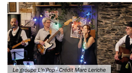
Le groupe L'n'Pop

Pour Mûrs des Arts, c'est ainsi retrouver la dynamique enclenchée il y a plus de 7 ans, renouer et maintenir le tissu relationnel, s'enrichir d'échanges de savoirs et de savoir-faire. Le collectif d'administration reste ouvert à toute personne désireuse d'entrer dans le groupe de réflexion sur la programmation ou tout simplement