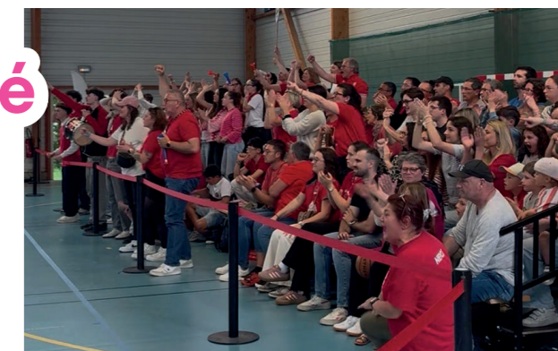
Les Diables Rouges à la demi-finale de la Coupe de l'Anjou

Contact: Krav Maga Angers, 11C chemin de la Barboterie, au 06 67 09 29 51 ou 06 43 45 08 76, ou à samuel.fresnet@hotmail.fr