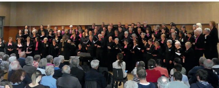
Concert du 11 avril KaléidoVox et Mosaïque, chant commun.

Contact: KaléidoVox, Chorale de Mûrs-Érigné, Maison des Arts, 18 rue Pierre Lévesque, à chorale.kaleidovox@gmail.com ou sur www.choraledemurserigne.fr