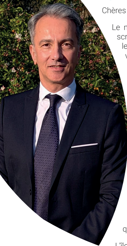
Fabien Véteau, Maire de la Ville de Mûrs-Érigné