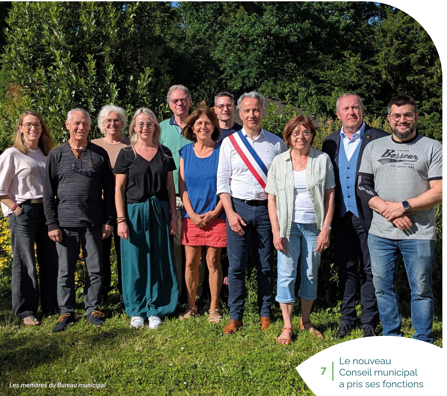
Les membres du Bureau municipal

7 | Le nouveau Conseil municipal a pris ses fonctions